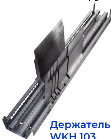
Держатель WKN 103