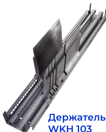
Держатель WKN 103