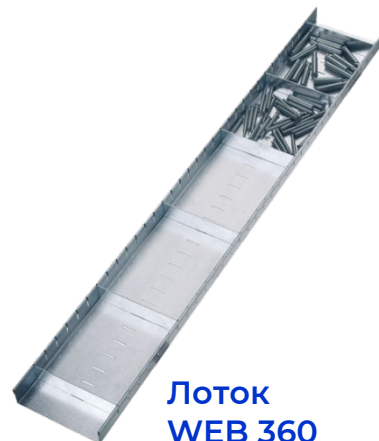
Лоток WEB 360